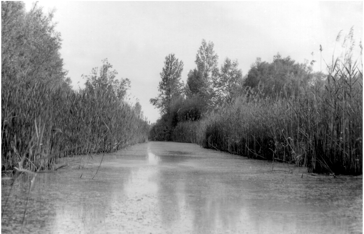
A LÖG VIZE A MOHÁCSI-SZIGETEN Valószínűleg középkorban készült vízvezető csatorna és csónakút Szerző felvétele, 1970.